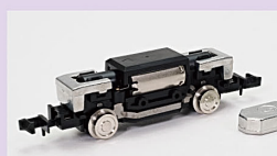
Nゲージ動力ユニット 2軸専用 TM-TR07 Nゲージ走行用パーツ セット(2両分) TT-03R Nゲージ走行用パーツセット (1両用) TT-06

3 別売りの動力ユニットを組み込むことで、Nゲージの線路を走行させることが可能。