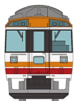
④キハ183系(登場時塗装)先頭車